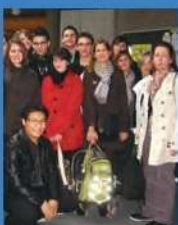
Partenariat Bingen Allemagne