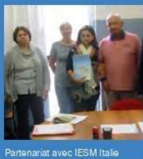
Partenariat avec IESM Italie