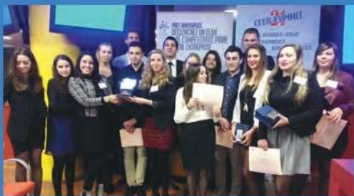
Trophée de l'export CCI

La création en STMG (sciences et technologies du management et de la gestion) d'une section européenne en anglais nous permet de conforter et de développer nos partenariats à l'international.