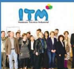
Partenariat avec ITM Espagne